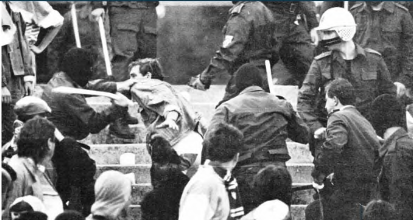
A felvétel nyilvánvalóan rendőri túlkapásról tanúskodik