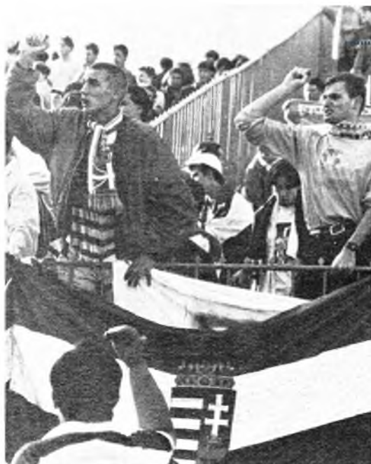
Több ezer magyar szurkoló volt a stadionban

A következő fordulóban a Slovan a kor egyik legjobb csapatát, az AC Milant kapta. Az olaszországi mérkőzésre elutazott egy kis, fradista szurkolói csoport, amely – Naszály György közlése szerint – az „In memoriam brutalitáti Slovaki, 1992. 09. 16.” (sic!) drapériát feszítette ki a San Siróban.