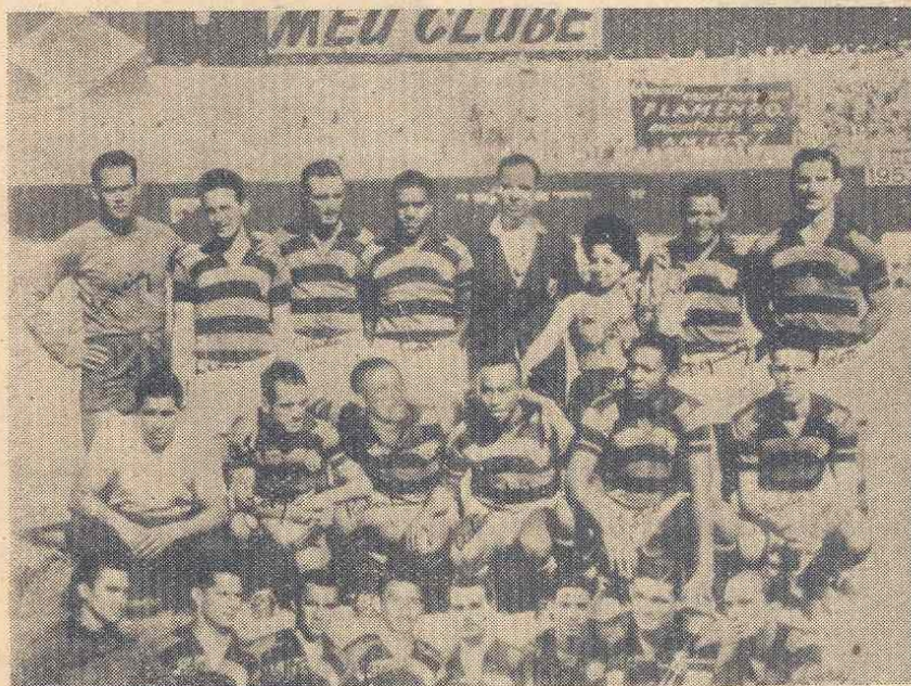
A Flamengo (Rio de Janeiro), Brazília bajnokcsapata