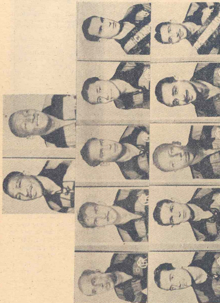
A Flamengo játékosai

Frankfurt: Flamengo — Frankfurter Eintracht (a nyugatnémet bajnokság második helyezettje) 1:1