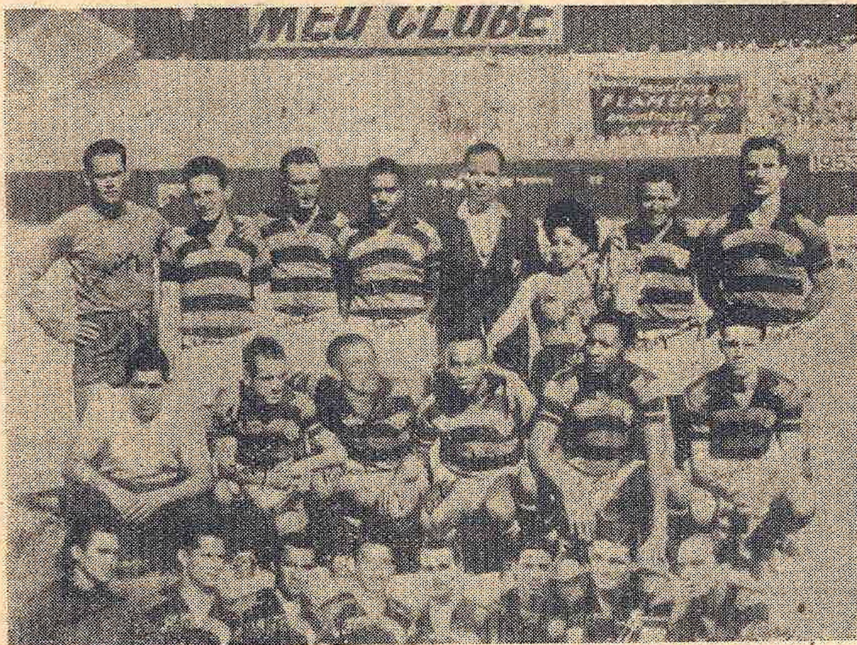
A Flamengo (Rio de Janeiro), Brazília bajnokesapata