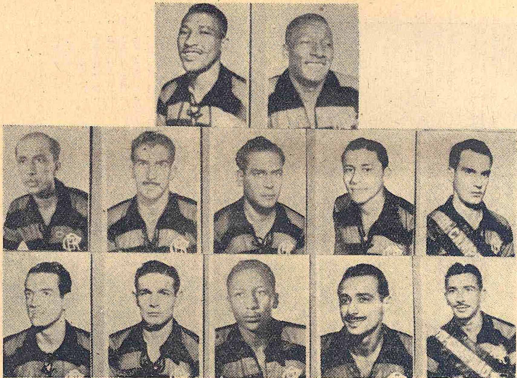
A Flamengo játékosai